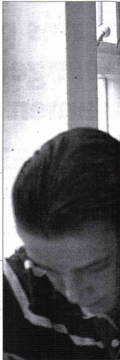
In de meivakantie gaan de lessen gewo...